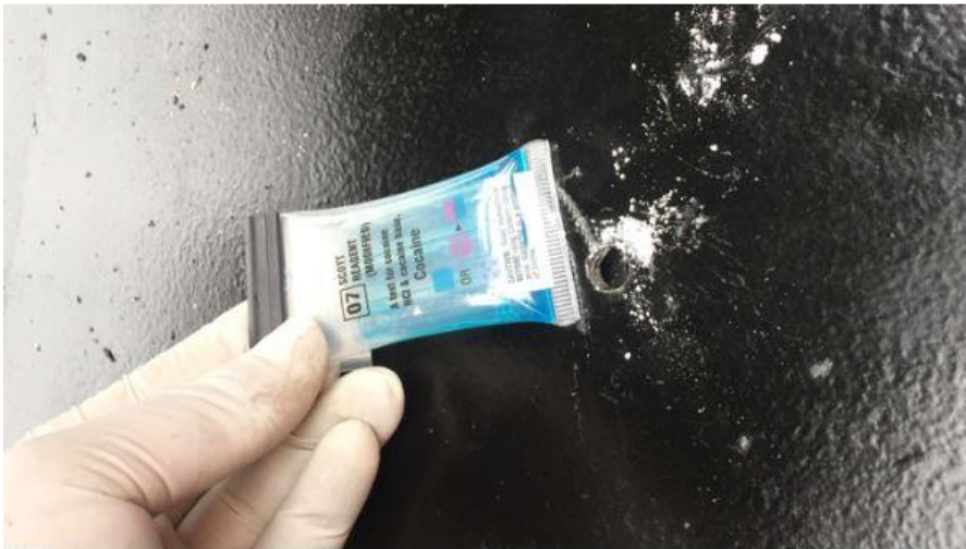
Reacción química durante pericias de incautación de cocaína.

21 de Enero de 2024 | 09:30 | Por Daniela Toro, Emol.