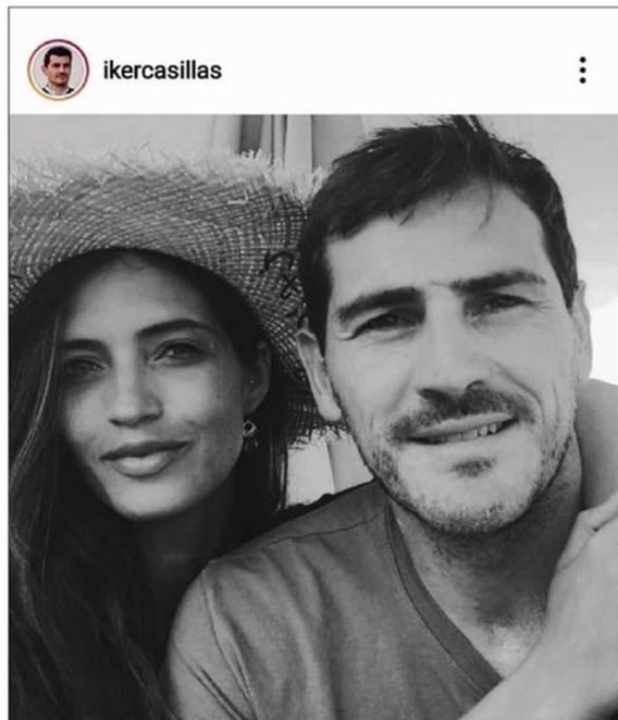
Los dos subieron esta foto para anunciar el quiebre.