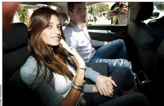
La relación duró once años y dejó dos hijos.