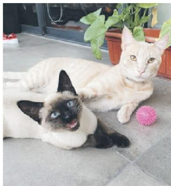
Freya y @franklin.gato de un año.

Dominio 2: Ambiente. Se relaciona con el medio ambiente donde habitan los animales. Se debe otorgar condiciones de protección, resguardo, seguridad y descanso, impidiendo que las mascotas escapen de casa para evitar riesgos de accidentes y enfermedades. También se debe propiciar confort físico y térmico, no deben padecer frío ni calor, protegiéndolos de las condiciones adversas del clima. Deben contar con espacio donde desenvolverse, un lugar cómodo donde descansar y resguardarse. Deben habitar ambientes limpios y modificar los ambientes donde vive la mascota si fuese necesario, a través de estrategias de enriquecimiento ambiental para cumplir con ello.