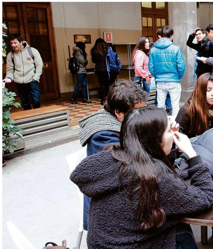
LOS ESTUDIANTES DE LA EDUCACIÓN SUPERIOR SE PREPARAN PARA VOLVER EN MAYOR NÚMERO A LAS CLASES

En tal sentido, resaltó que "dado lo anterior y si las condiciones sanitarias se vuelven aún más favorables, como se ha ido dando, por ejemplo, con el nuevo escenario en fase 4, todas las asignaturas podrían pasar a un formato completamente presencial. No obstante, hemos definido que esta transición se irá produciendo de forma gradual y luego de hacer una evaluación de las condiciones de seguridad. En el caso de que algunos estudiantes, por razones excepcionales, no puedan retomar presencialmente al