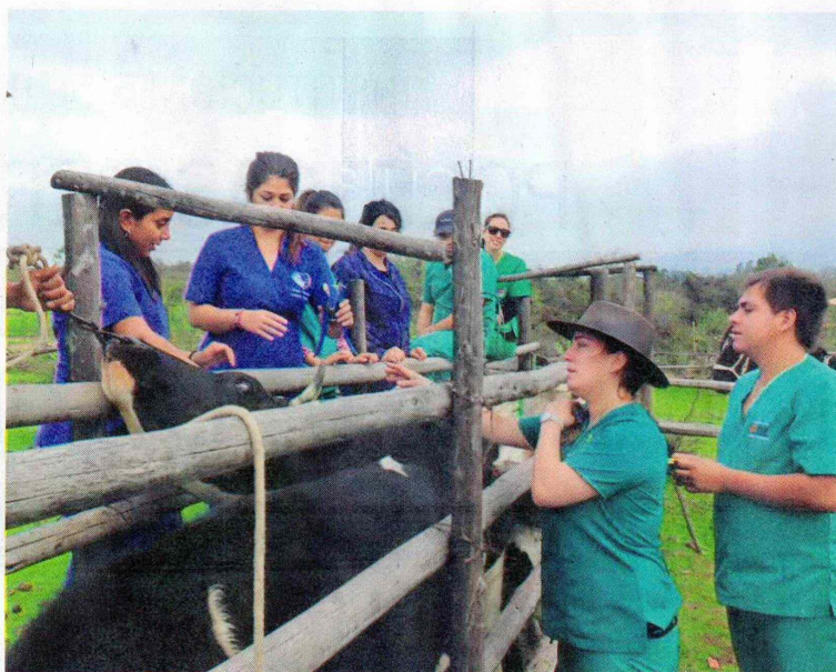
Estudiantes y docentes de UDLA de diversas carreras realizan operativos ciudadanos en sus tres sedes, en la Región Metropolitana, Valparaíso y Biobío.