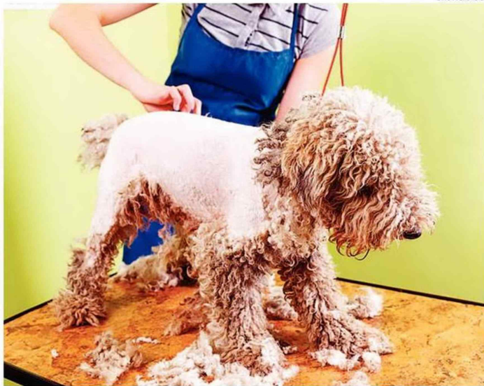
EL CORTE DE PELO PUEDE AYUDAR A ELIMINAR LAS MOTAS DE PELO.

“A veces se piensa que se hace un gran favor cortando el manto (pelo) a nuestros perros, sin embargo, hay que considerar la raza y tipo de manto, que en invierno los protege del frío y en verano del sol, ya que tienen una función protectora para los rayos ultravioleta, así como también es una capa protectora de aire