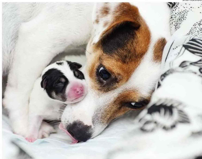
LA HEMBRA REGULA SU ACTIVIDAD FÍSICA DURANTE LA GESTACIÓN.

Los dueños deben sí o sí llevar a su animal doméstico al veterinario para que sea monitoreado. Es fundamental cambiarles la alimentación durante esta etapa, evitar que la futura madre se estrese y no suspender los paseos.