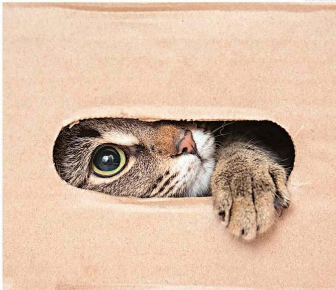
LOS FELINOS DISFRUTAN JUGANDO CON CAJAS DE CARTÓN.

Especialistas recomiendan utilizar como insumos elementos simples como cartones de papel higiénico. Los juguetes deben mantener motivados a sus animales domésticos, pero sin generarles ansiedad.