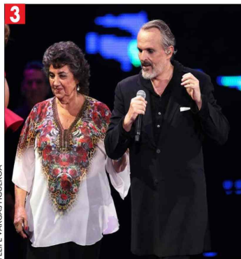
Autoridades sobre el escenario como acto político para lucirse más ellas que los artistas.