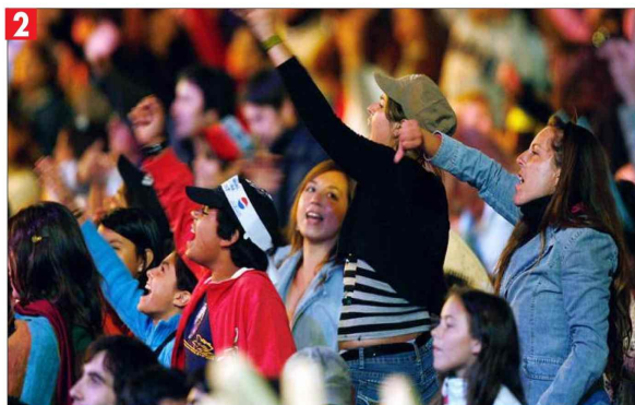
El público está más cuidadoso de no maltratar al otro con sus abucheos.

Título: Estos son los 4 gestos festivaleros que ya están obsoletos