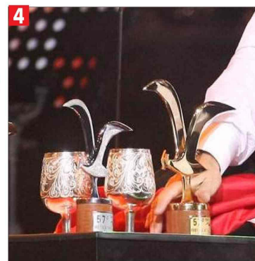
Los reconocimientos responden a una cultura fetichista que necesita imágenes.

Un sicólogo experto en temas sociales y un sociólogo analizan el comportamiento de público y artistas