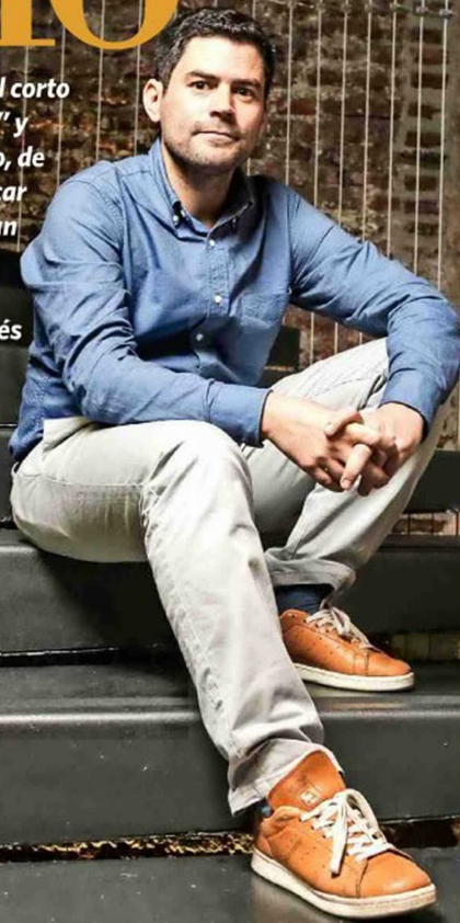
AGRADECIMIENTOS: HOTEL MAGNOLIA, THERMANS 539, HOTEL MAGNOLIA