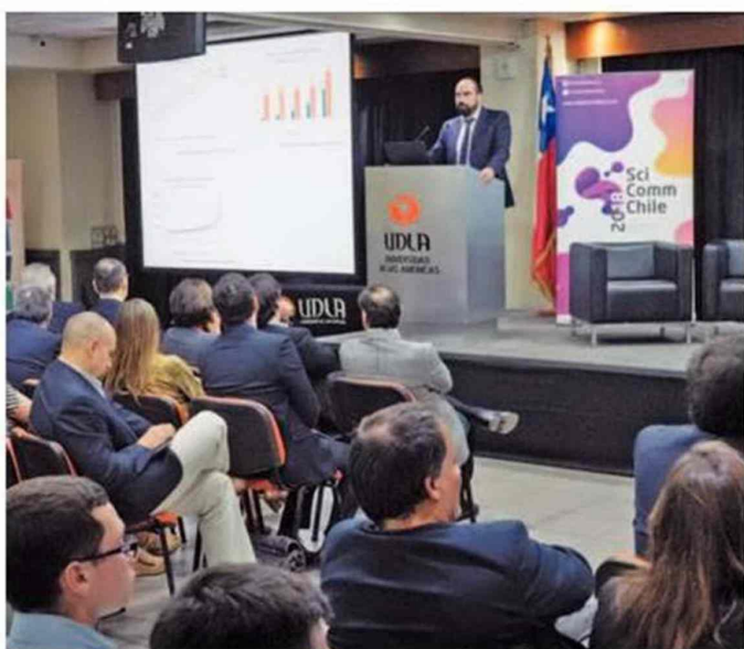
Imágenes del conversatorio organizado por el Consejo de Universidades Privadas (CUPa), junto a ChileCientífico y Universidad de Las Américas (UDLA).

Título: La importancia en la transparencia de la información para los nuevos estudiantes universitarios